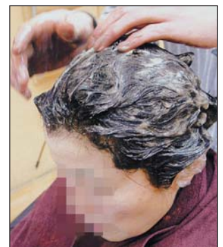
■ 乳 化 ■