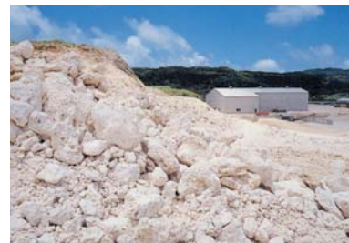
■■■ 沖縄県与那国島 粉体化プラント

カルシウムは体内でその99%が骨や歯に貯蔵されていますが、血液や体液に含まれるわずか1%のカルシウムが、実は命を支えるうえで大変重要な働きをしています。まず、神経や筋組織における情報伝達の媒体となり、カルシウムなくして脳も心臓も動かすことができません。また血液の凝固に携わり、酵素の働きを助け、ホルモンの分泌にも深く関与している重要な物質です。カルシウムが不足すると骨粗鬆症はもとより高血圧や動脈硬化、心筋梗塞、脳卒中、糖尿病、リウマチ、腎臓結石など様々な疾病へのリスクが高まります。